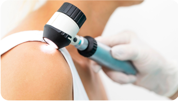
Public : Médecin généraliste