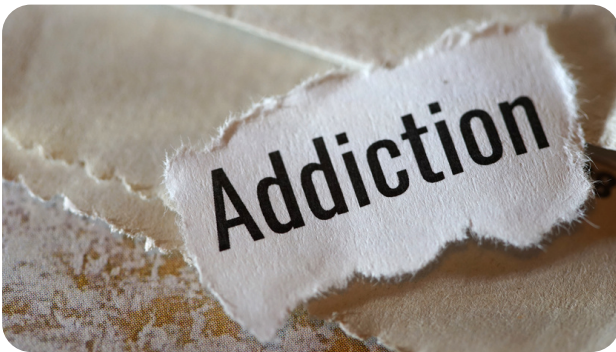
Public : Médecin généraliste

Les cancers de la peau sont parmi les plus fréquents des cancers avec près de 80 000 nouveaux cas par an en France. Le diagnostic tardif accroît rapidement la mortalité pour le mélanome, et à moindre degré pour le carcinome épidermoïde, tandis que les effets destructeurs locorégionaux grèvent le pronostic fonctionnel et limitent les possibilités de réparation.